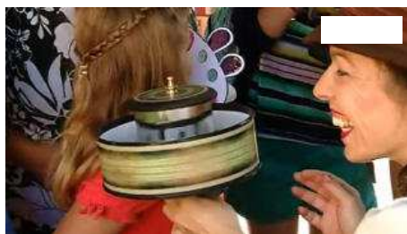
Imagen de la Feria de la pasada edición.